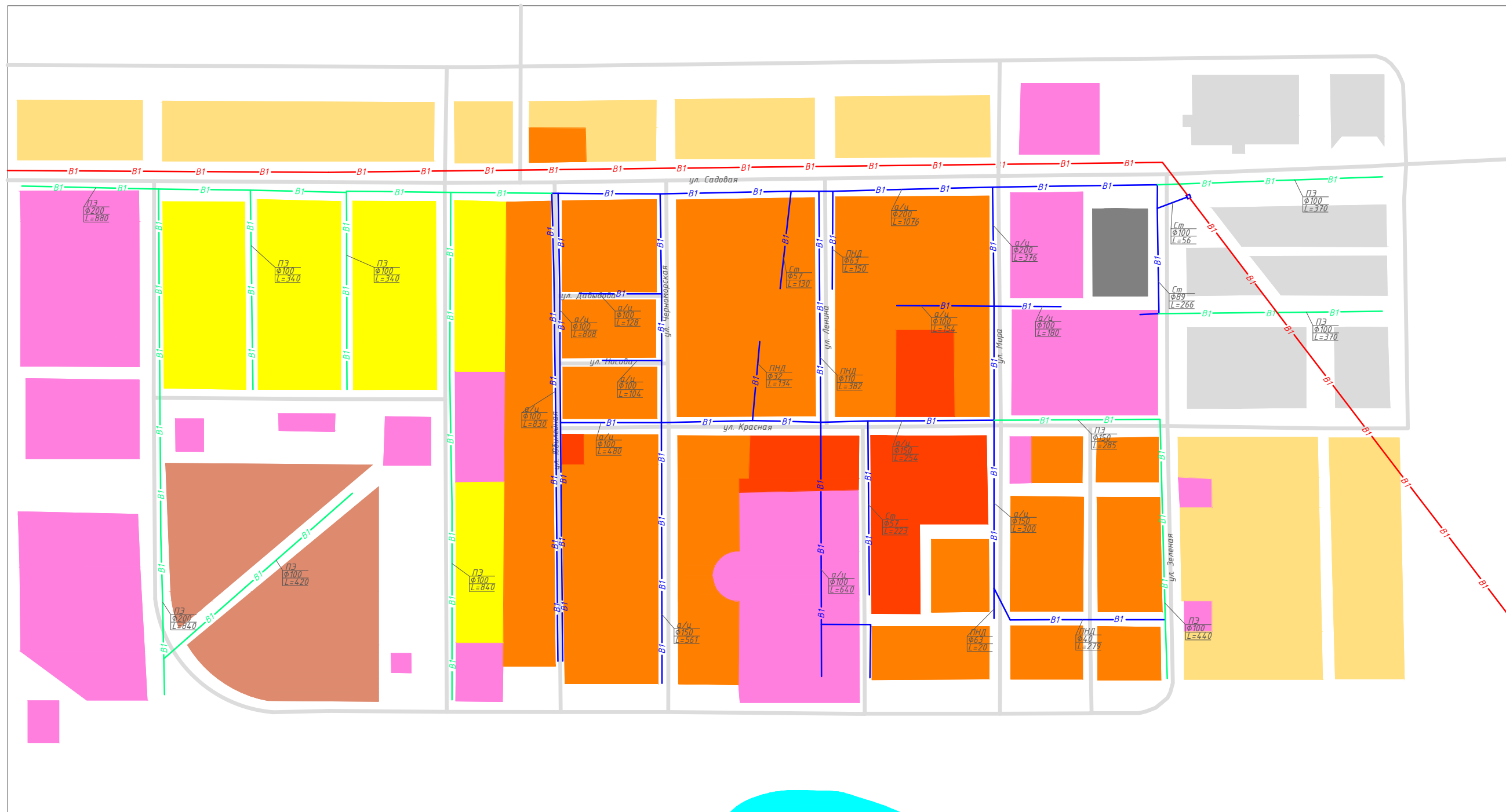
СХЕМА ВОДОСНАБЖЕНИЯ ПОСЕЛКА ЮБИЛЕЙНЫЙ